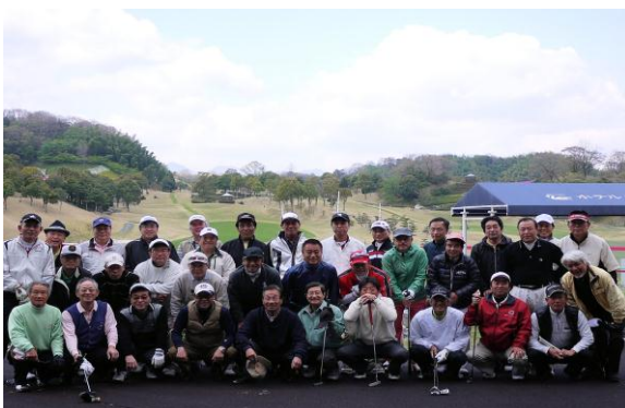
第4回安城RC・西尾KIRARA RC合同ゴルフコンペ