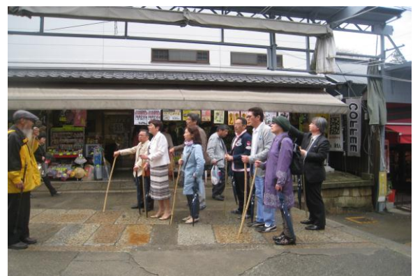
観劇同好会 金毘羅歌舞伎鑑賞